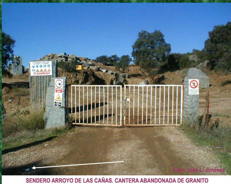
SENDERO ARROYO DE LAS CAÑAS. CANTERA ABANDONADA DE GRANITO

el conocido camino de Almadén . Durante estos primeros kilómetros observaremos un paisaje de dehesas salpicadas de batolitos de granito o porrilla como se conoce popularmente en el municipio. Este tramo está parcelado en pequeñas explotaciones familiares y dedicadas en su mayoría a la ganadería extensiva de vacuno y ovino. A unos 2 kilómetros de su inicio, también veremos a nuestra derecha una cantera de la ya mencionada piedra de granito y que actualmente está abandonada.