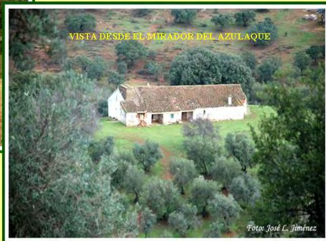
VISTA DESDE EL MIRADOR DEL AZULAQUE

Después de un descanso, avanzamos por un pequeño descenso en un carril abrupto, donde a ambos lados del carril, nos deleitaremos con el aroma y la vista, de la flora autóctona, como lo son el romero, lavanda y la jara pringosa .