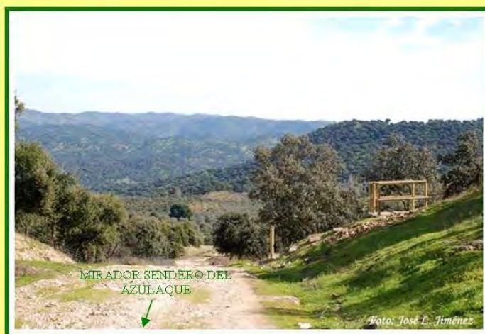
MIRADOR SENDERO DEL AZULAQUE

Seguimos, y tras rebasar un paso de aguas fluviales, a nuestra derecha, con un bosque de ribera, iniciaremos una pendiente ascendente de un kilómetro aproximadamente, la cual nos brinda, si giramos la vista a tras, un paisaje muy bonito. A dicha altura, y una vez culminada la pendiente, encontraremos a la izquierda un pequeño mirador que nos deleitará la vista, tanto a nuestra izquierda como a nuestra derecha, observando unas pequeñas casitas, conocidas como las colonias y otras en forma de cortijos