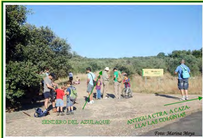
SENDERO DEL AZULAQUE